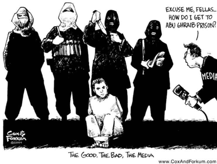
2. ábra A Jó, a Rossz és a Média

Az Internet egy másik ilyen reklám jellegű felhasználása mikor nyíltan, bárki számára szabadon elérhető weblapokon keresztül próbálják terjesztani ideológiáikat, világnézeteiket. Egyes szervezetek saját weblapokat üzemeltetnek, melyek letiltása sokszor országhatárokon átnyúló jogi nehézségekbe ütközik. Ha mégis sikerül 1-1 ilyen jellegű oldalt betiltani, akkor sem zár be a weblap, hanem csak szervert, országot cserélve üzemel tovább.